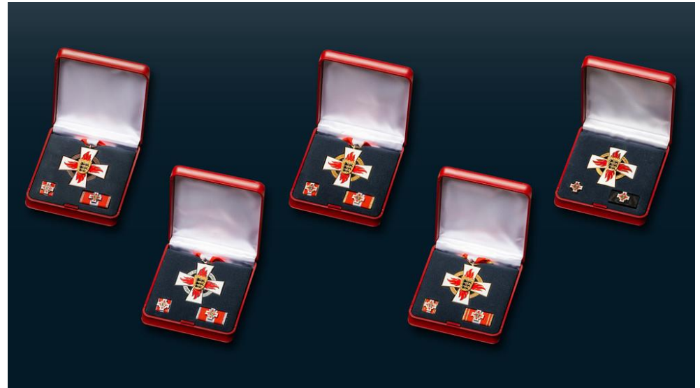
Die Ehrenzeichen des Landes Baden-Württemberg in Bronze (15), Silber (25), Gold (40), Gold in besonderer Ausführung (50) und der Sonderstufe (v.l.n.r)

Gerne teilen wir an dieser Stelle mit, dass im nun auslaufenden ersten Ehrungszyklus der Hauptversammlungen 649 (!) Ehrenzeichen in Bronze verliehen wurden. Besten Dank an die Stellv. KBM für die verlässliche Unterstützung in unzähligen Hauptversammlungen und herzlichen Dank – auch von dieser Stelle – an die Geehrten!